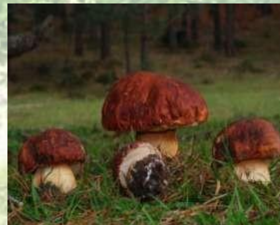
Boletus pinophilus Pilat & Dermek