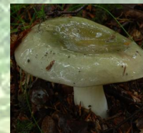
Russula virescens (Schaeffer) Fries