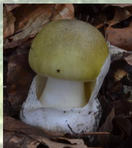
Amanita phalloides (Vaill. Ex Fries)