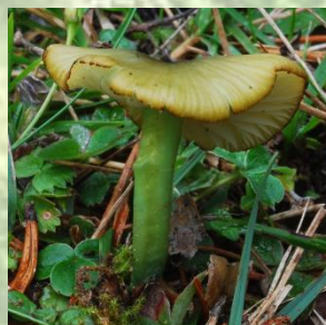
Entoloma incanum (Fr) Hesler

22:00 h: CENA PARA LAS INTEGRANTES DE LAS SOCIEDADES PARTICIPANTES.